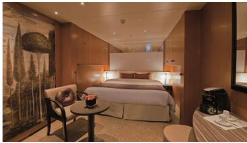
★内側 (2-4人 約16.6㎡)