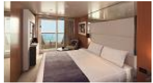
バルコニー(2-4人 16.6㎡+バルコニー5.5㎡)