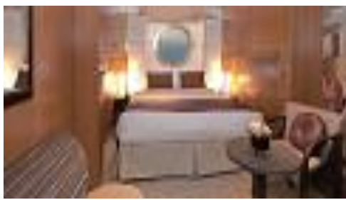
★海側 (2-4人 約16.6㎡)